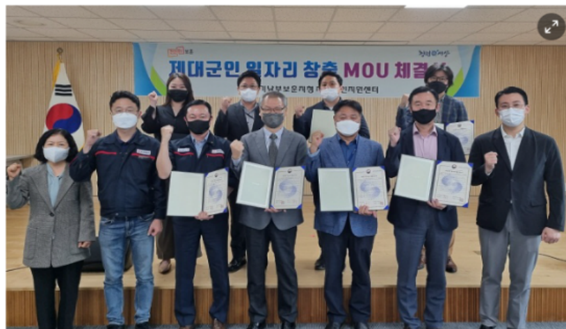
6일 오전 경기남부보훈지청 제대군인지원센터가 제대군인 일자리 창출을 위한 업무협약식을 진행했다.